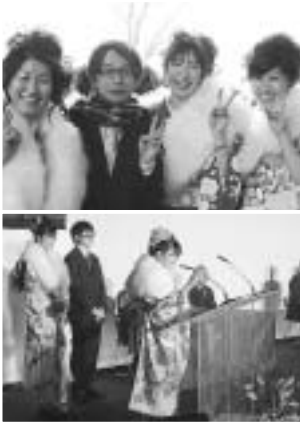
平成21年成人式の様子

平成22年の成人式は1月10日に白鳥アリーナで開催し、約1千700人の方が新たに大人の仲間入りをします