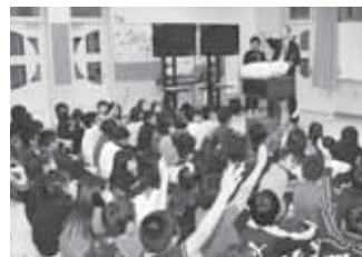
▲港クイズに答える拓勇小学校の皆さん