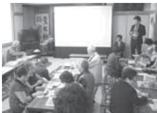
▲美光町内会での出前講座の様子

今年度の特設講座として、企業や町内会、老人クラブ、小学校などでこれまでに15回開催し、820の方に参加いただきました。