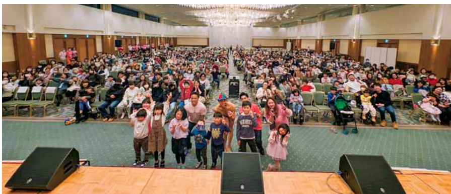
▲来場者全員で記念撮影