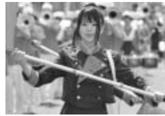
~ 第56回港まつり ~

8月7日(日)、港まつり3日目に行われたマーチングフェスティバルの様子。参加者は力強いパフォーマンスで会場を魅了していました。まつり期間中は32万1,000人が訪れ、苦小牧の夏を満喫しました。