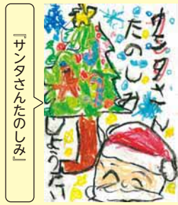
「サンタさんのしめしめ」