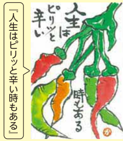
「人生はピリッと辛い時もある」