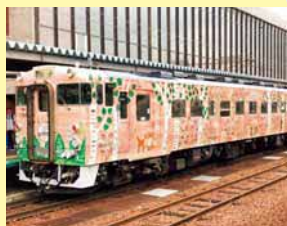
●「道央 花の恵み」 2019年9月運行