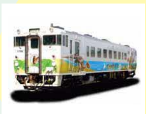
▲「カムイサウルス(むかわ竜)復興列車」 2021年10月運行