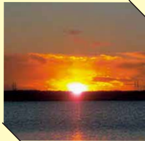
「ウトナイ湖 日の出」