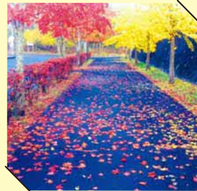
「銀杏・紅葉競演」 美園町 旗振りおじさん