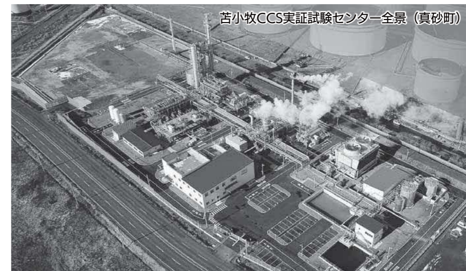
苫小牧CCS実証試験センター全景（真砂町）

CO 2 を資源として、化学品や燃料、鉱物などの製品に再利用することで、大気中に放出されるCO 2 を削減する新たな温暖化対策の取り組みです。