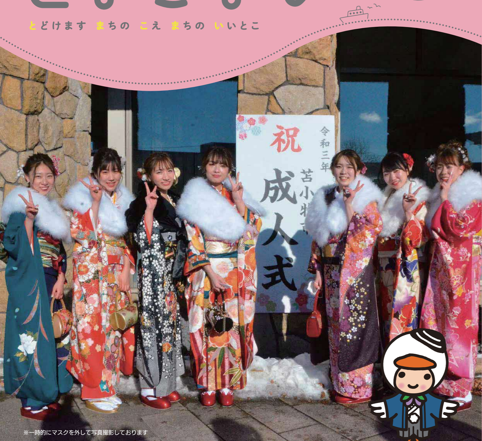
※一時的にマスクを外して写真撮影しております

※紙面に関するご意見・ご感想は下記まで 広報とまごまい 令和3年2月1日発行 第1815号