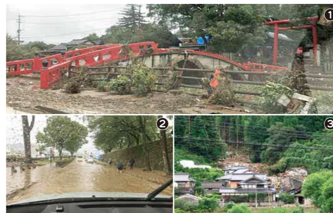
①令和2年7月5日、熊本県人吉市の様子（気象庁提供） ②大雨により発生した土砂崩れ（令和2年7月13日撮影 気象庁提供）