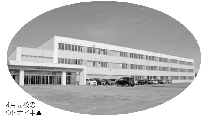
4月開校のウトナイ中▲

「教育大綱」とは、「地方教育行政の組織及び運営に関する法律」に基づき、苦小牧市の教育、学術および文化の振興に関する総合的な施策について、その目標や根本となる方針を定めるものです。