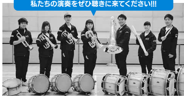
▲マーチングバンド マーチングバンド演奏(13時~14時)