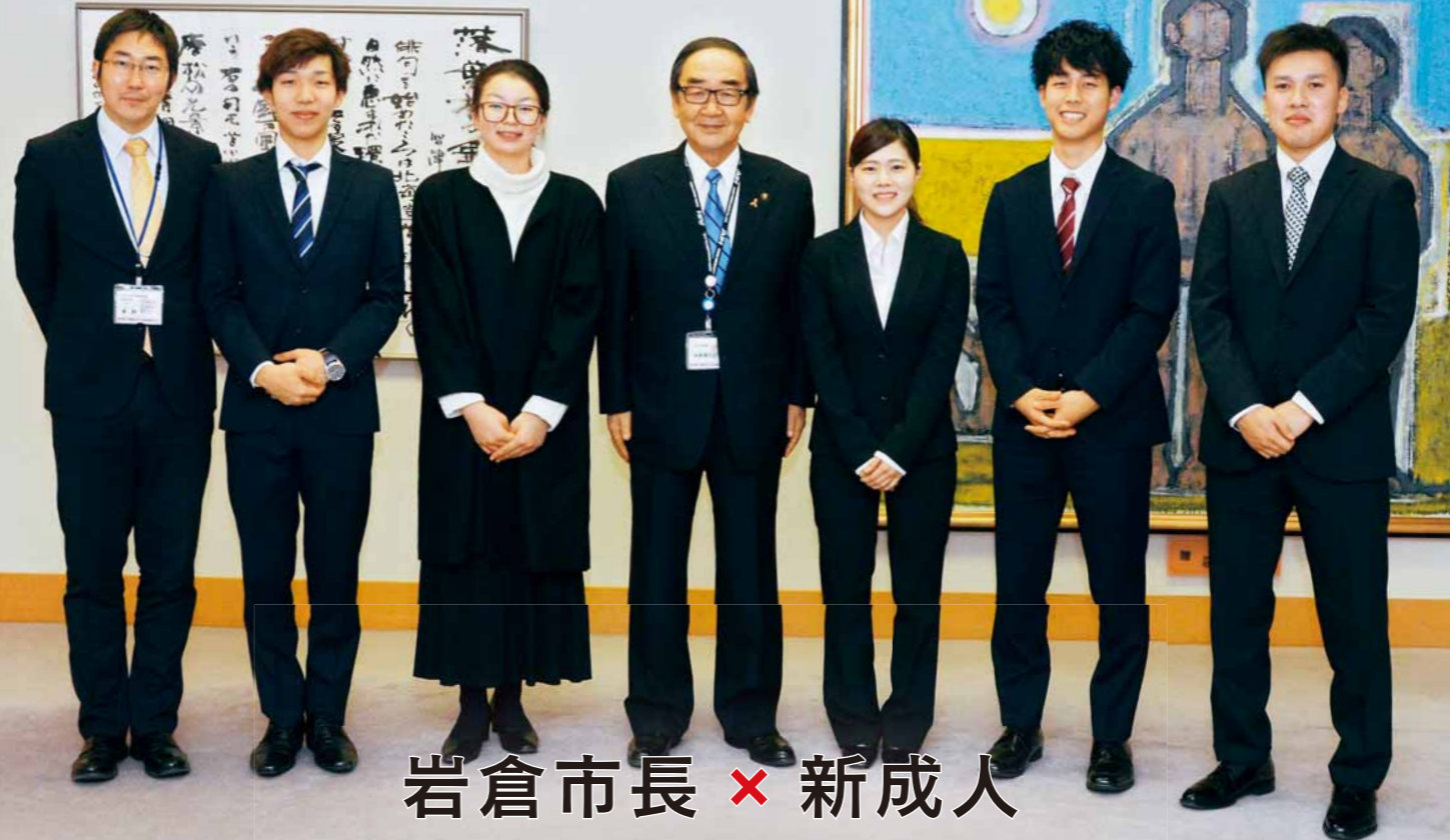
岩倉市長 × 新成人