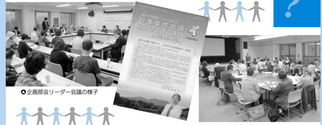
企画部会リーダー会議の様子

教育、健康、介護、災害、貧困、DV、差別・人権、平和、仕事と家庭の調和(ワークライフバランス)、多様な人材活用(ダイバーシティ)など、男女平等参画社会を実現するためのテーマはさまざまです。これらを講演会やシンポジウム、または各種分科会で取り上げ、課題の解決策を探っていきます。 日本女性会議2017とまこまい実行委員会では、総務部会、ウエルカム部会、企画部会を設け、市民・団体や企業からもたくさんの方々に協力をいただきながら、有意義な会議となるよう、精力的に準備を進めています!