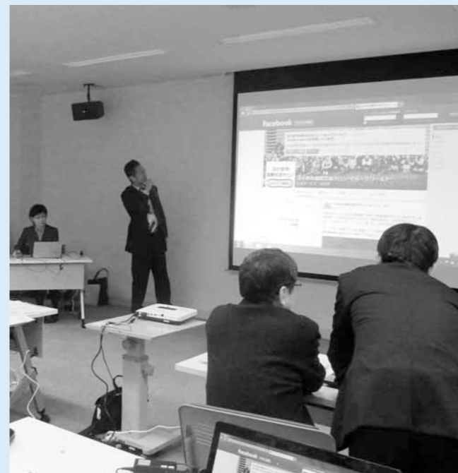
▲町内会フェイスブック開設 キックオフ説明会

本年度、市と市民自治推進会議との取り組みとして、若年層へ町内会の加入を働き掛けるため、モデル地区に対する支援をしています モデル地区については、平成28年2月に募集を行い、応募のあった町内会の中から第八区自治会（緑町、木場町、春日町の一部で構成）を選定しました