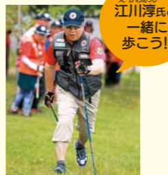
カルガリーオリンピッククロスカントリースキー日本代表選手