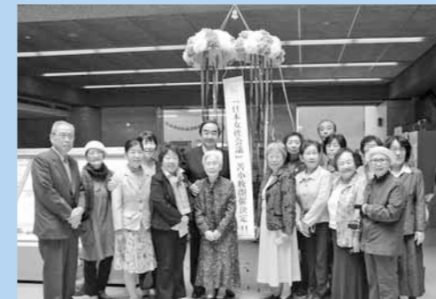
苫小牧開催決定のセレモニー

来年秋、本市において「日本女性会議2017とまこまい」が開催されます。「日本女性会議」は、男女平等参画社会の実現に向けた課題の解決策を探るとともに、参加者相互の交流促進や情報ネットワーク化を図ることを目的とした全国規模の会議です。1984年に名古屋市内で第1回が開催され、それ以降、県庁所在地や政令指定都市などを中心に全国各地で開催されてきました。北海道では、2014年の札幌市に次いで2度目となり、苫小牧市が34回目の開催地となります。