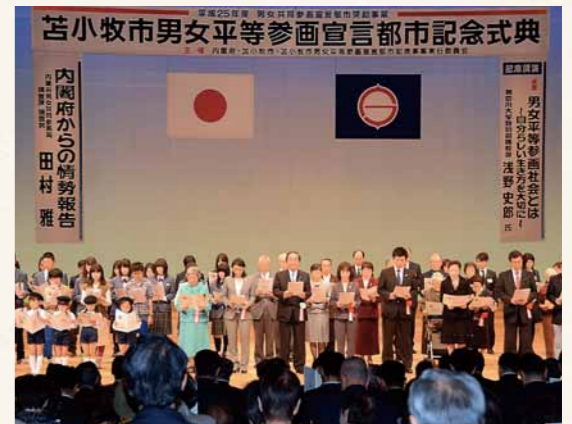
●苫小牧市男女平等参画宣言都市記念式典