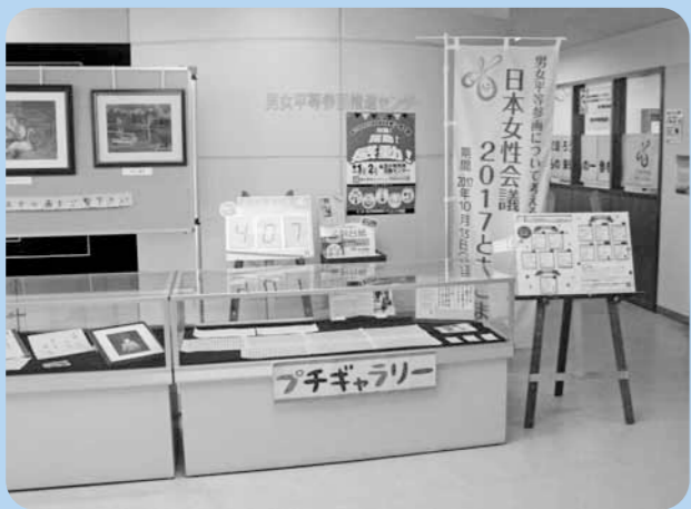
●男女平等参画推進センター