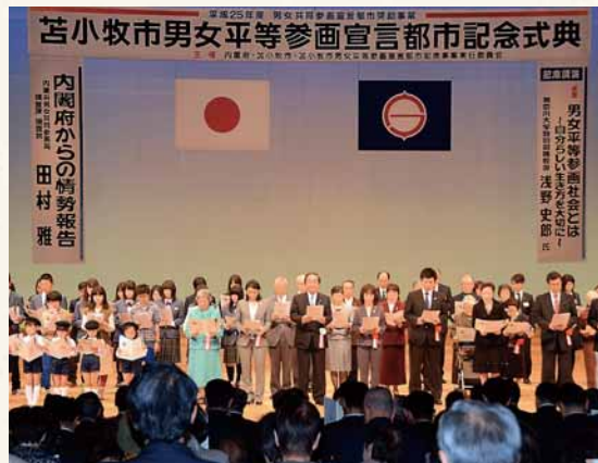
●苫小牧市男女平等参画宣言都市記念式典