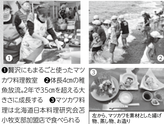
①賢にもまもるごを使ったマツカワ料理教室 ②体長4cmの稚魚放流。2年で35cmを超える大きさに成長する ③マツカワ料理は北海道日本料理研究会苫小牧支部加盟店で食べられる

35cm以上という大きさが、繊細な味わいが特徴の魚です。焼いても揚げても美味しく、色んな料理で楽しめます。その中でも私のお薦めは、マツカワならではのプリっとした弾力や、上品な甘みを感じられます。マツカワはたくさん食べても、魅力を秘めた魚です。これからの季節、もっと多くの人に美味しさを伝えていきたいです。ホッキ貝に続く「新しい苫小牧の顔」にしていきます。