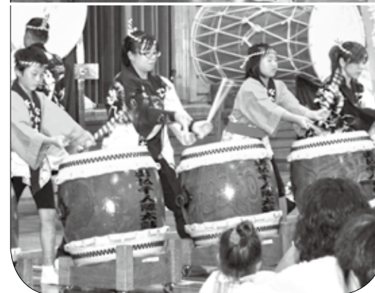
▲上：勇払小学校での練習風景 (10月4日(金)) 下：八王子市との姉妹都市盟約40周年を記念した文化交流公演での演奏の様子 (10月5日(土))

勇払千人隊御会所太鼓は、苦小牧開拓の祖とされる「八王子千人同心」の苦難や想いを太鼓の曲で表現し、風化させることなく語り継ぎたいと、昭和45年に創始されました。現在は「勇払中学校太鼓同好会」や、小学生による「チビッコなかよし太鼓」を含む、子どもから大人までの28人で市内外のイベントで活