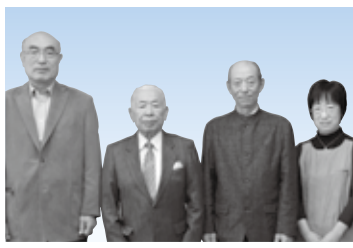
とまこまいびじゅつぎょうかい 苫小牧美術協会

昭和14年の設立以降、全国的に活躍する作家を多数輩出。また、公募展を開催し、出品や芸術鑑賞の機会を提供するなど、本市の美術文化の向上・発展に寄与。そのほか、市内の教室で美術指導にあたるなど、本市の生涯学習の普及・振興にも大きく寄与。