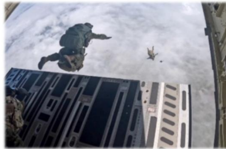
輸送機からの跳び出し