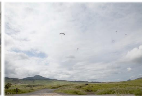
自由降下傘の操縦