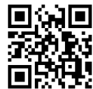
お問い合わせフォーム (google フォーム)リンク

「 有料プログラム 」のページの「 お申込みの流れ 」の「 お問い合わせフォーム（google フォーム） 」から 希望の日時やプログラム、学年や人数等のご入力の上 、お申込みください（右記、QRコード）。