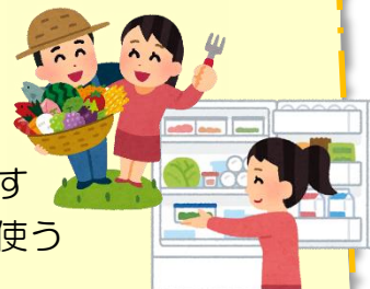
エシカル消費について 消費者庁 HP