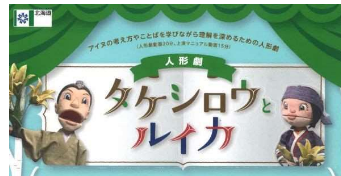
北海道が制作した人形劇動画紹介