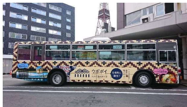
実際にラッピングされたバスの例