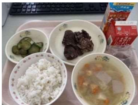
むかわ町での給食例 (ユク竜田 (鹿肉))