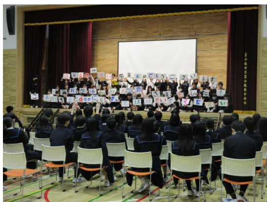
1年生の発表のラストシーン

3月11日(水)、生徒会が中心となり企画、運営した「3年生を送る会」を行いました。後輩から先輩へ—これまでお世話になった感謝の気持ちを伝える「意義深い時間」になりました。1年生、2年生ともに限られた時間の中で練習し、一生懸命に取り組んでくれました。3年生もその姿に、きっと「熱い想い」を感じてくれたことでしょう。