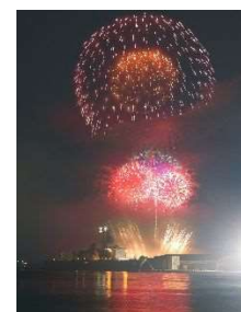
銅賞 村上 秀