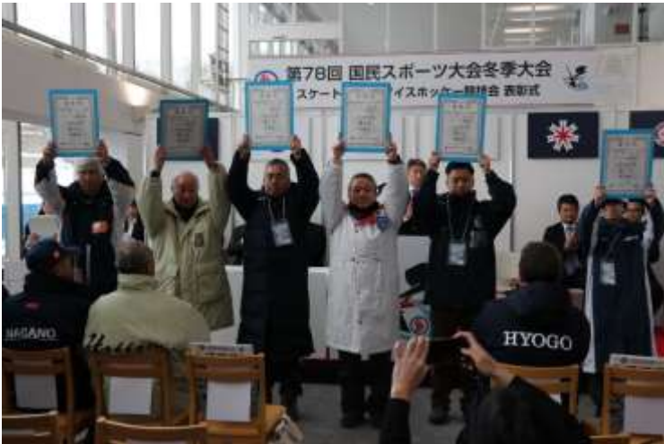
男女総合成績（天皇杯得点）