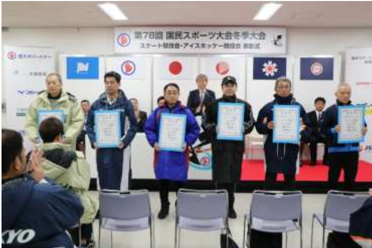
総合成績（天皇杯得点）