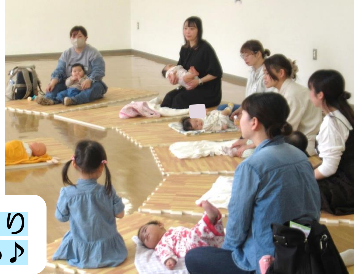
腰のマッサージはゆっくり手を動かすといい気持ち♪

さまざまな週数の大きさをした胎児の人形に触れながら妊娠中からおなかのマッサージができること。マッサージを通してお母さんとお子さんが笑顔になること。触れ合うことの大切さを教えてもらいました。