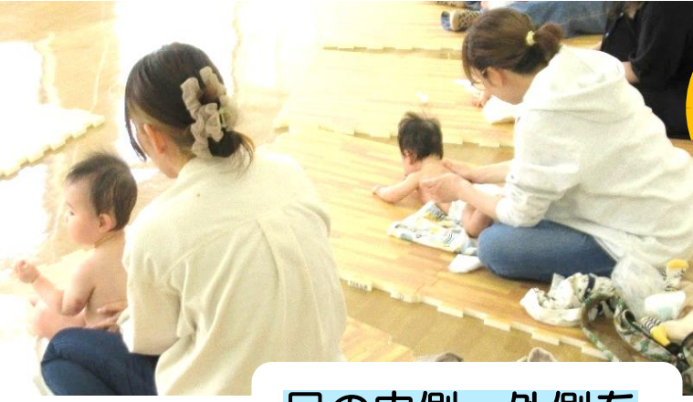
足の内側、外側を交互にマッサージ