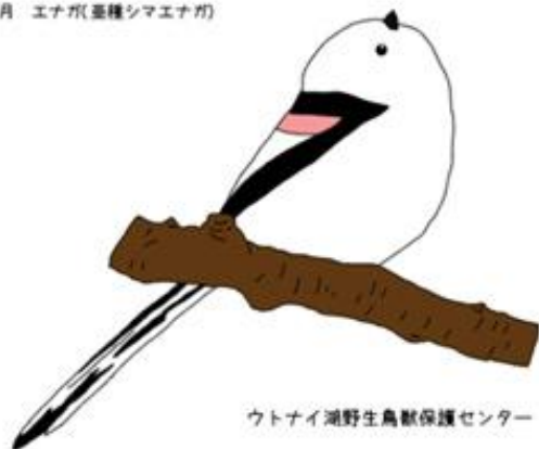
ウトナイ湖野生鳥獣保護センター