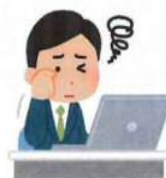
抗酸化で疲労回復