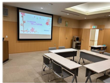
<花しょうぶの会 会場>