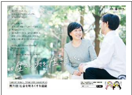
(内閣総理大臣メッセージ)