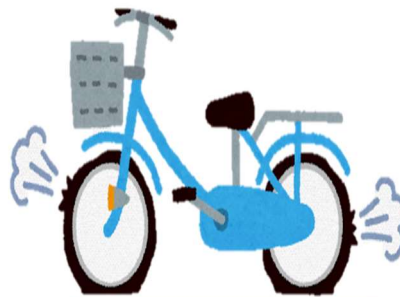
故障したままの乗車