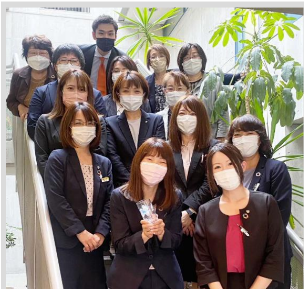
第一生命保険株式会社 苫小牧営業支社 苫小牧営業オフィスの皆さん

とまチョップ水は、苫小牧の美味しい水を加熱殺菌することで、より飲みやすい水になっています。軟水であるため、ご飯をさらに美味しく炊けたり、和食を作るときにもぴったり！このように、飲む以外の味わい方をもっと広めていきたいです。