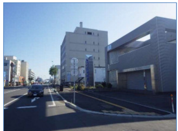
バリアフリー化実施箇所 （市道駅前本通～市道新川通）