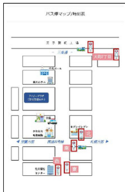
バス乗降所の掲載 (ホームページ)