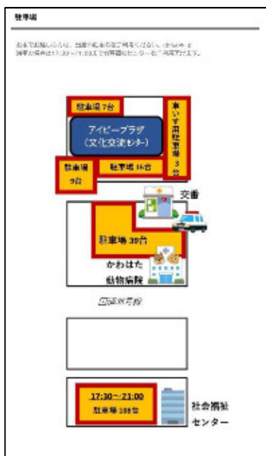
駐車場位置の掲載 (ホームページ)