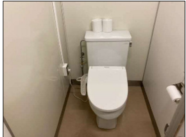
暖房・温水洗浄便座設置