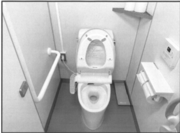
トイレの洋式化、手すり設置