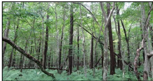
林内の倒木発生状況

対象区域約6.3haにおいて、令和6年度に森林所有者から森林整備の同意を得られた森林について、令和7年度に危険木や支障木の伐採を行う。