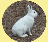
エソユキウサギ (冬毛)