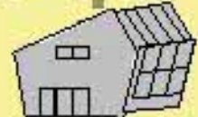
ネイチャーセンター