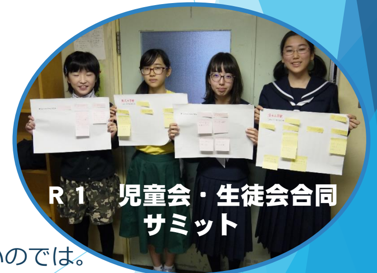
R1 児童会・生徒会合同 サミット