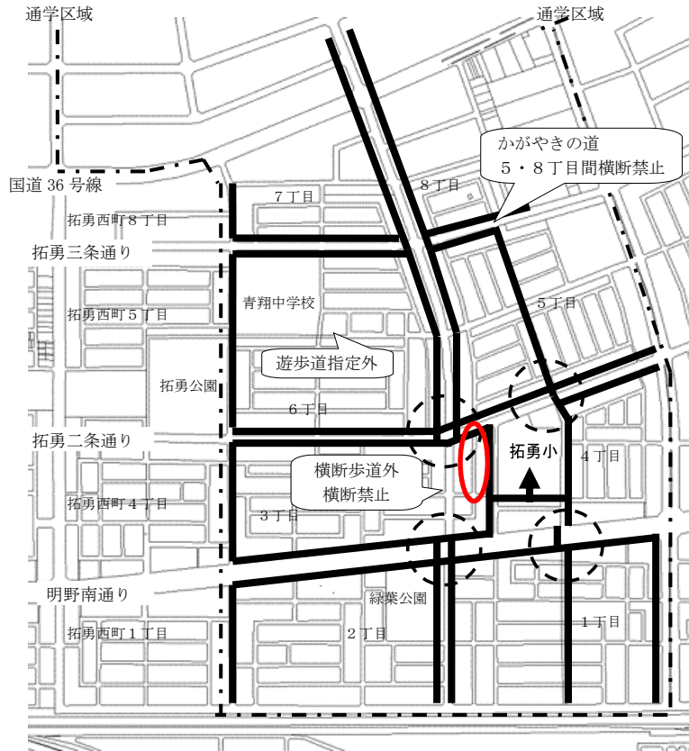
拓勇小学校付近の拡大図