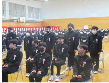
・担任からの呼名