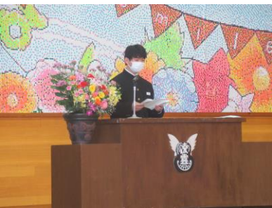
・生徒会代表のこたば