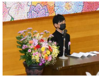
・新入生代表のこたば