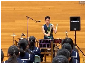
（和太鼓：しんたさん）