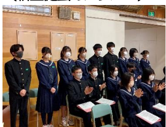
(旧生徒会のメンバー)