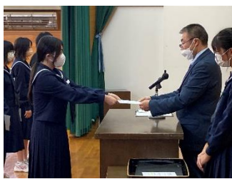
(認証状を受け取ります)