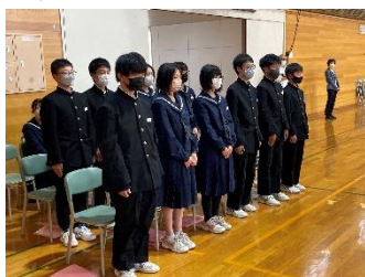
(新生徒会のメンバー)

新生徒会役員、各学級常任委員の認証式が行われました。前期同様に、呼名された委員の「はい」の返事、さらには、参加したすべての生徒の態度も立派でした。後期の活動、よろしくお願ひします。