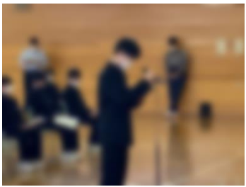
・学級代表からの意見