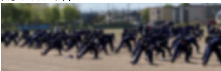
・凌雲中伝統の「よさこい」。本番が楽しみです。

5月18日(水)から体育大会に向けての本格的な練習が開始。全学年で「よさこい」の練習です。27日(金)の大会の様子は次号でお伝えします。