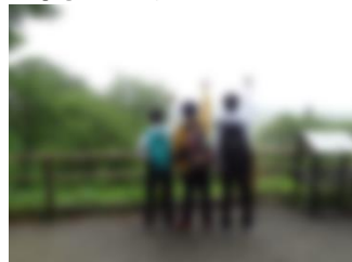
・約束! 「また来るから」