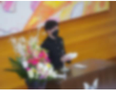
・生徒会代表の言葉