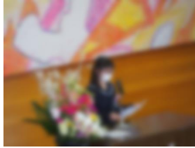
・新入生代表の言葉