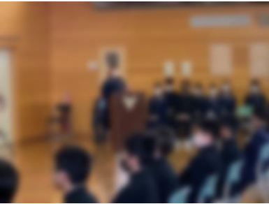
・生徒会役員の運営

【認証式】 4月19日（火）、前期学級委員・生徒会役員認証式が行われました。呼名された委員の「はい」という返事が大変素晴らしいです。また、参加したすべての生徒の態度も立派でした。活気ある生徒会活動を期待します。