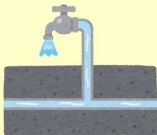
水道水汚染や油臭など 生活環境への被害