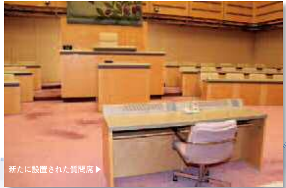
新たに設置された質問席▶