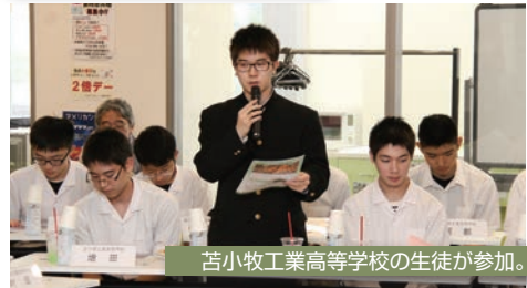
苫小牧工業高等学校の生徒が参加。

第3回苫小牧市議会だより「フリートーク」がココトマ（表町）で8月20日(月)に開催されました。