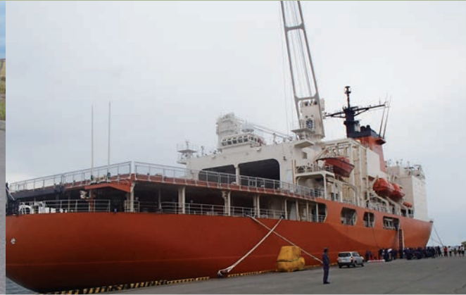
2 入浴支援などを行った自衛艦「しらせ」