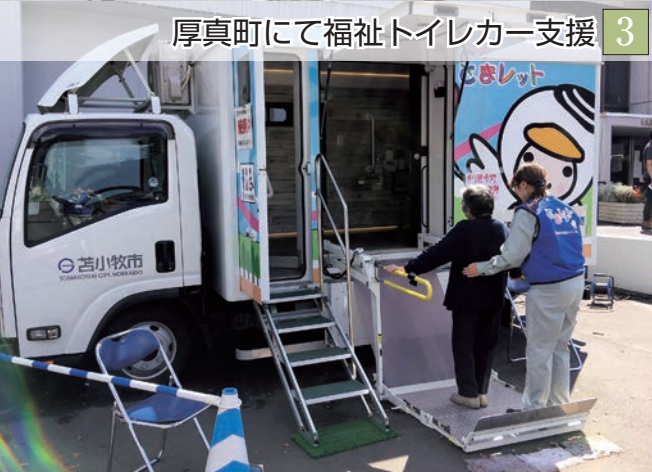
厚真町にて福祉トイレカー支援