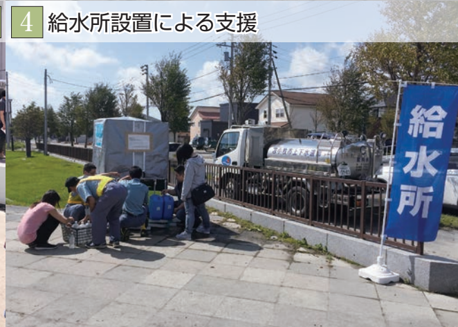
4 給水所設置による支援

北海道胆振地方中東部を震源とする地震が、9月6日午前3時7分に、本市を含め厚真町・安平町・むかわ町など道内を襲い、本市でも、2人の尊い命が失われ、21の方が骨折やけがなどで負傷されました。 また、北海道全域での停電の発生により、市民生活に大きな支障が生じました。 本地震で、お亡くなりになられた方に謹んでお悔やみを申し上げますとともに、被災された皆様にご心よりお見舞い申し上げます。一日も早いご回復をお祈り申し上げます。 苫小牧市議会は、地震災害による市民の安全と災害復旧を第一に考え会期を短縮いたしました。 今後とも、議員一同市民の皆さまが安全安心で暮らせるまちづくりのために全力で取り組んで参る所存ですので、ご協力とご支援をお願い申し上げます。