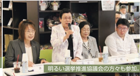
明るい選挙推進協議会の方々も参加。