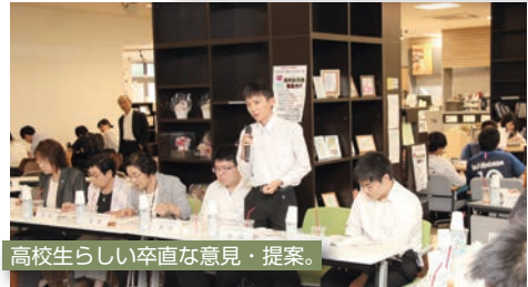
高校生らしい卒直な意見・提案。