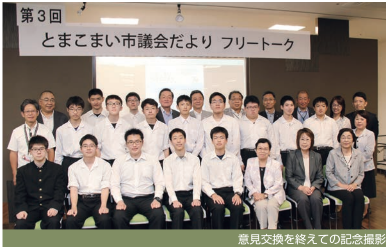
意見交換を終えての記念撮影