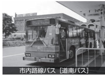
市内路線バス「道南バス」

質疑の中で委員から「市が道南バスに対し路線への補助金を出しているのに、一方で無料送迎バス（イオンへ）を出している」ことを問題視。市側は、「あまり過度なことがあれば言わなければならぬ」と述べた。また道南バスと市が行っている運行連絡会議の中で、運転手のマナーや対応が悪いなど20件を超える苦情が市民から寄せられていることも明らかにされました。