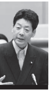
矢嶋 翼 議員

★国際リゾート誘致構想で、外国語修得やショー出演のための、人材育成機関が必要との指摘に、インターナショナルスクール、観光・宿泊などのホスピタリティ産業や音楽などのエンターテインメント関連の教育施設設置の考えがあると答弁がありました。