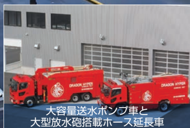
大容量送水ポンプ車と 大型放水砲搭載ホース延長車