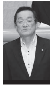
岩田 典一 議員

★学校周辺や繁華街の防犯カメラの設置増の指摘に、32年度からの防犯カメラ設置5カ年計画の中で、効果的な場所への設置を考えると答弁がありました。