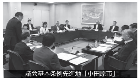
議会基本条例先進地「小田原市」

また、四日市市では、具体的な議員間討議を運用するにあたっての詳細な内容について調査し、議員間の議論は深まるがそれが市側に施策として