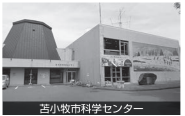
苫小牧市科学センター

が、建物の老朽化などさまざまな計画との整合性を図り、今後のあり方として「理科・化学の好きな児童・生徒を育てる機能のさらなる充実」をはじめら項目から13策が示され、次世代を担う青少年に対する科学的知識の普及・市民生涯学習の場としての機能の充実・強化に取り組みと示されました。