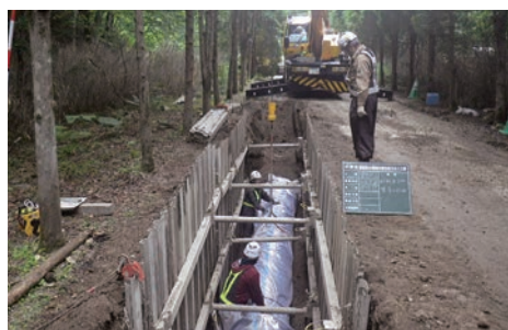
耐震化に向けて日夜水道管の布設替え工事が行われております。