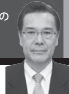
小山 征三 議員 http://www.tomakomai.or.jp/koyama/