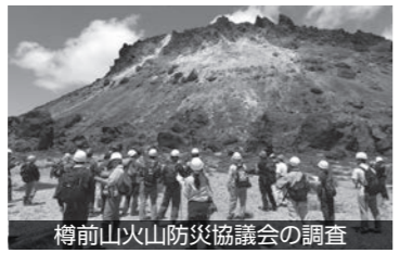
樽前山火山防災協議会の調査

所管事項は社会福祉法人沼ノ端はくちょう会と福祉避難所の協定を締結したことなど4件あり、樽前山噴火に係る避難計画の検討では、法改正に伴い樽前山火山防災協議を見通した内容が、報告されたとの説明がありました。弾道ミサイル発射情報や市民周知では、消防サイレンの活用を行うことから、これまでの消防サイレンも含め市民周知をおこない、30年9月頃から開始を予定するとしました。（仮称）市民ホールの民間活力導入可能性調査について、30年9月までに検討することとしました。