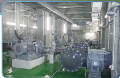
勇振ポンプ場内には、Φ300mmのポンプが3台設置され、1日約4万トンを高丘浄水場に送水する能力を有しています。

また、各家庭などに配水するための管路についても、基幹管路の耐震化率は、63.12%（60,125km/95,260km）となっており、安定した供給のため布設替え工事が進められております。