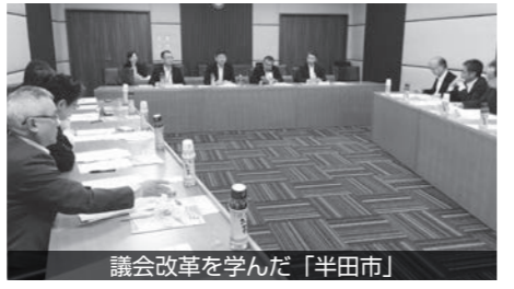
議会改革を学んだ「半田市」

反映する場合は課題などもあることが分かりました。最終日は半田市を訪問し、どのように議会改革を進めたのか背景などの詳細を聞きまし