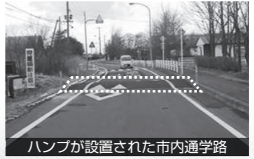
ハンブが設置された市内通学路

全国で登下校中の児童が交通事故で死傷する事象が発生し、その多くの原因は「歩道が狭い」「スピードを出す車両が多い」などでした。市は通学路の安全確保を目的にハンブや横断歩道のカラー着色、防護柵などを設置し、対策後の効果を検証。一定の効果があつたことから今後さらなる交通安全対策に向けた取り組みを行います。