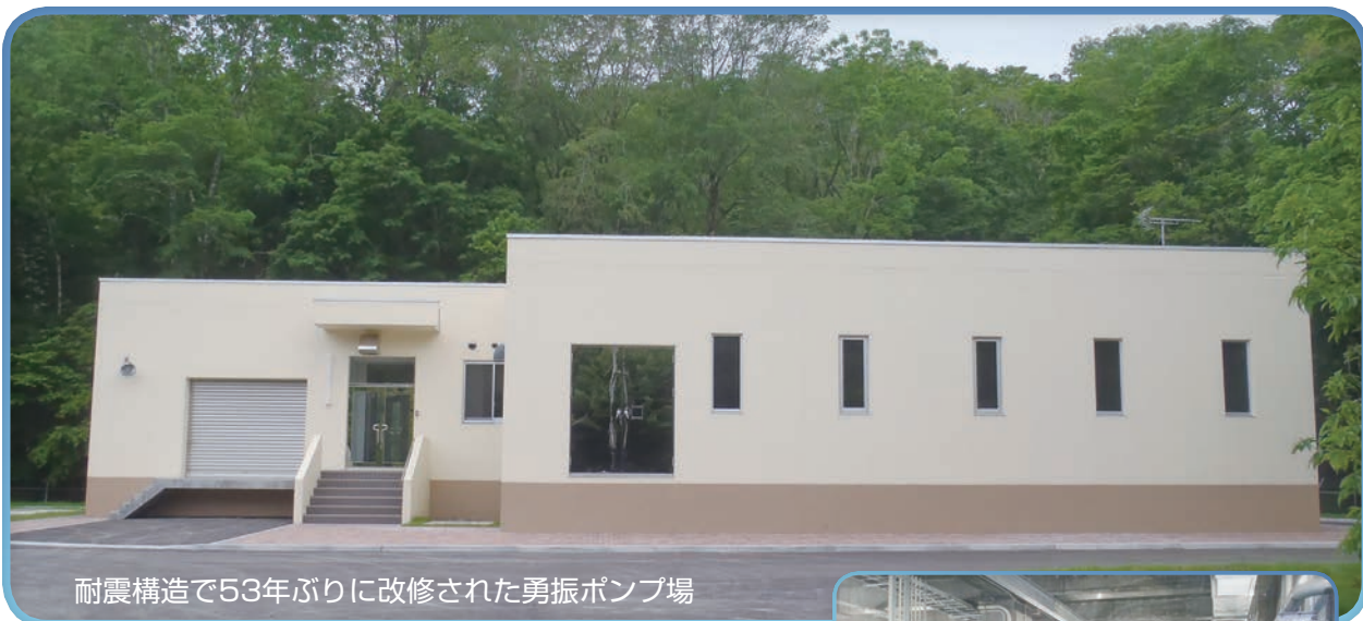
耐震構造で53年ぶりに改修された勇振ポンプ場

苫小牧市では、水道水の安定供給のため耐震化工事が進められており、浄水場施設では、82%、基幹管路では63%が耐震化されております。