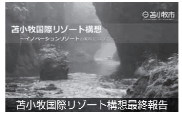
苫小牧国際リゾート構想最終報告

所管事項は7件あり、その中で質疑が活発に繰り広げられたのが、「苫小牧国際リゾート構想」でした。