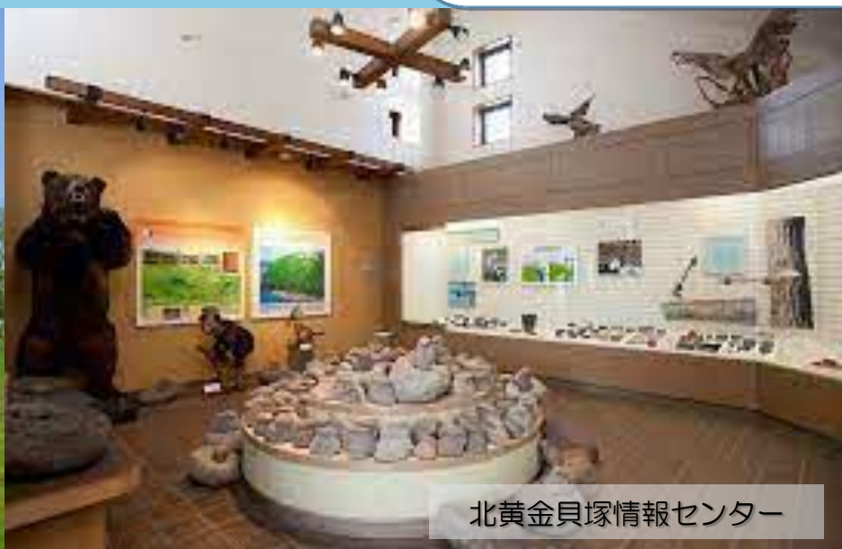
北黄金貝塚情報センター