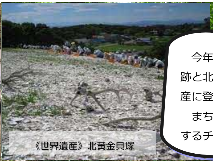
《世界遺産》北黄金貝塚