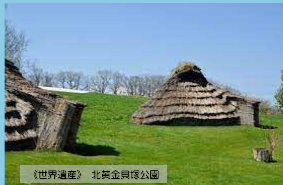
《世界遺産》北黄金貝塚公園

＜文化財発見ツアーについて＞ 苫小牧市内外にある、国・道・市指定などの貴重な文化財を巡るバスツアー。専門学芸員等の解説もあります。