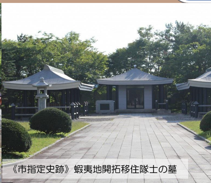
《市指定史跡》 蝦夷地開拓移住隊士の墓