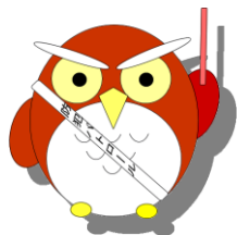
マスコットキャラクター「まもる」くん