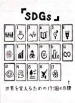
「SDGs」世界の発展のための17の目標

「自転車盗難」それは、とても身近に起きている事件だ。実際に自転車を盗まれた人として、みなさんが被害者になるための知識を知ることがある。まず、去年と今年七月時点での自転車盗難件数を見てほしい。