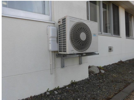
【青翔中学校保健室 室外機】