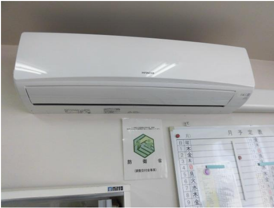
【青翔中学校保健室 室内機】