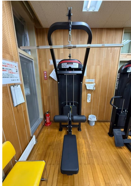
【ラットプルダウン】