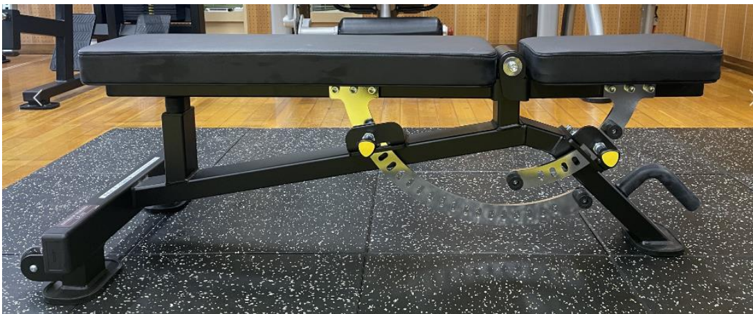
【アジャスタダブルフラット/インクラインベンチ】