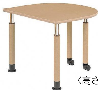
〈高さ可動式テーブル〉