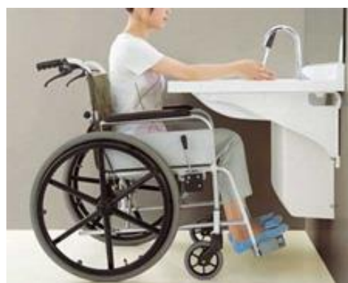
〈対応洗面所への改修工事〉