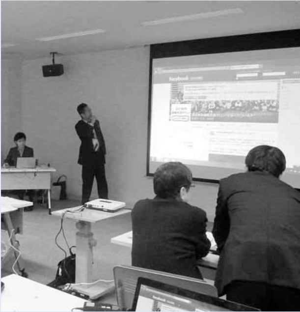
▲町内会フェイスブック開設 キックオフ説明会

モデル地区については、平成28年2月に募集を行い、応募のあった町内会の中から第八区自治会（緑町、木場町、春日町の一部で構成）を選定しました